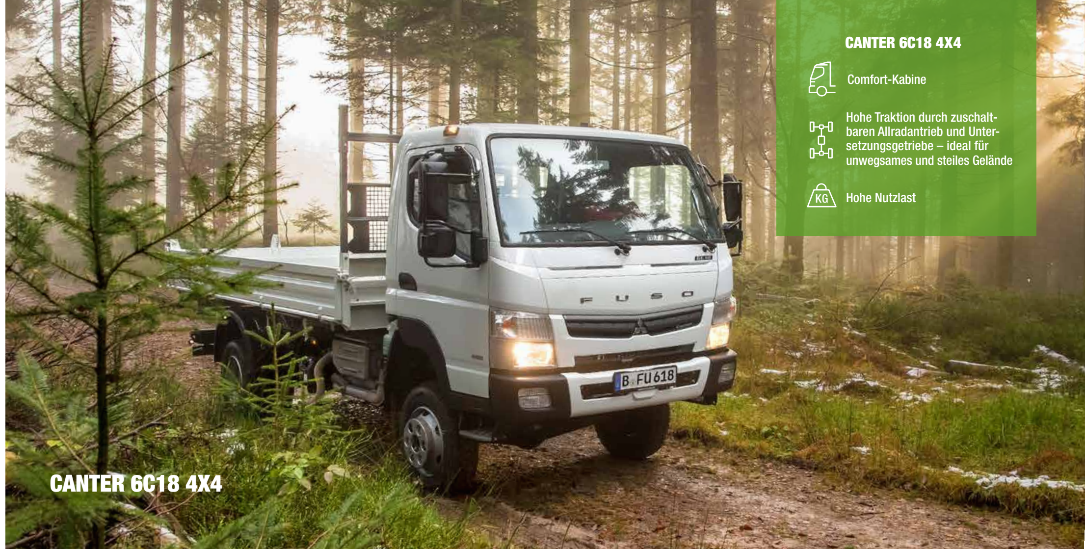
CANTER 6C18 4X4

Hart im Nehmen. Für besonders schwere Einsätze auf unbefestigtem Gelände verfügt die Modellvariante Canter 6C18 4x4 über eine vergrößerte Bodenfreiheit und einen zuschaltbaren Allradantrieb – das sorgt abseits von befestigten Straßen für besonders hohe Traktion.